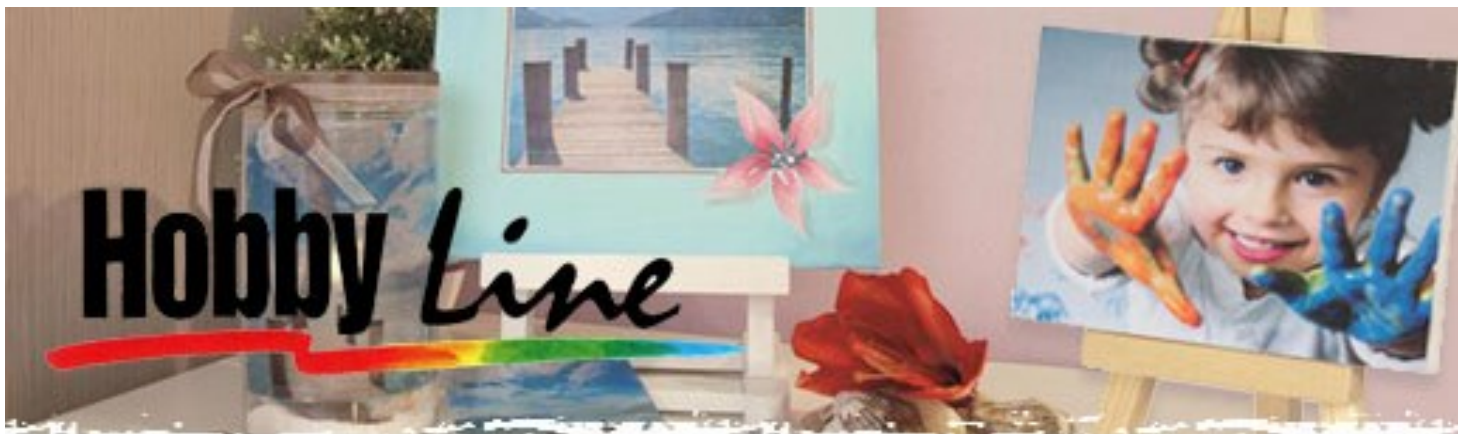
Foto Transfer Potch

Overfør bilder til underlag som lerret, kartong, tre, etc. Etter påføring anbefaler vi å bruke en lakk for at motivet skal fremstå klart og fargesterkt, bruk for eksempel vnr. 79401 Hobby Line Glans Lakk